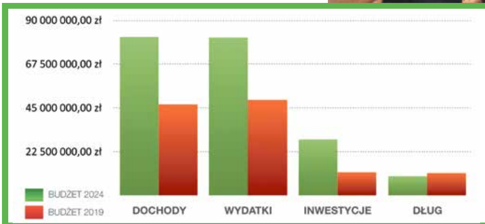
Zestawienie budżetów Gminy Woźniki z początku i końca kadencji samorządu 2018-2024

Burmistrz zaznaczył, że budżet jest nastawiony na odpowiedzialny rozwój. - W ciągu ostatnich 5 lat nie tylko podwoiliśmy dochody, utrzymaliśmy przy tym stabilny, bezpieczny poziom zadłużenia. Dodał, że wśród ważnych inwestycji znajdą się i te realizowane przez starostwo. - To przebudowa ul. Romanowskiej w Kamieńskich Mły-