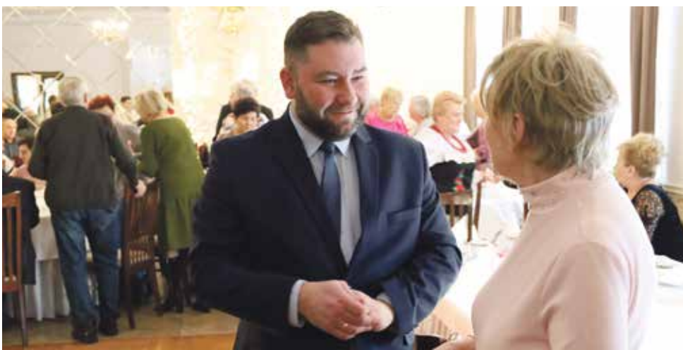
Na terenie naszej gminy regularnie organizowane są spotkania władz samorządowych z seniorami. To okazja do podziękowania osobom starszym za ich wkład w rozwój społeczności, zapewnienie im wsparcia i pomocy. Dla seniorów to także szansa do nawiązania nowych znajomości i wymiany doświadczeń.

Jeśli zdecydujecie Państwo o powierzeniu mi zaszczytnej funkcji Burmistrza Woźnik jestem gotów podjąć się realizacji tych, wymienionych powyżej, ambitnych zamierzeń. Jestem przekonany, że razem możemy uczynić naszą gminę jeszcze lepszym miejscem do życia, pracy i wypoczynku. Niech będzie ona wzorem dla innych i dumą dla nas wszystkich!