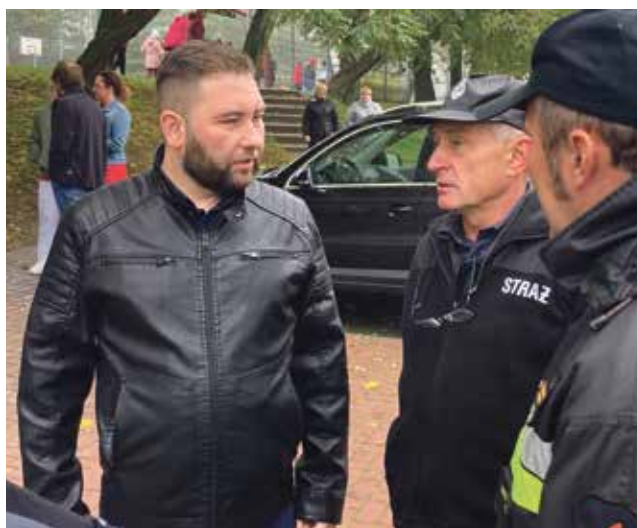
Strażacy z naszej gminy mogą liczyć na wsparcie władz samorządowych m.in. w kwestiach zakupu sprzętu i wyposażenia dla jednostek OSP

Finanse spełniają kluczową rolę w zarządzaniu jednostką samorządu terytorialnego. Dla szerokiego obszaru zadań publicznych wykonywanych przez sektor samorządowy konieczne jest zapewnienie niezbędnych do ich realizacji środków.