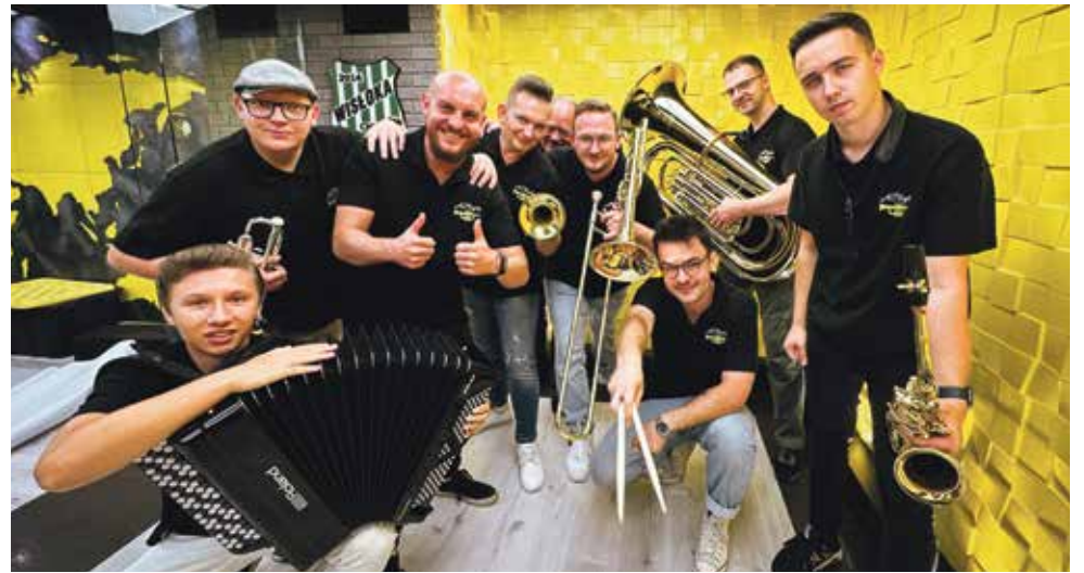
Zespół kontynuuje swoją muzyczną podróż, z dumą promując rodzime tradycje na największych scenach świata. Trzymamy kciuki za ich nadchodzący występ w Teksasie!

Działający od 2018 roku zespół AllDęte z Kamienicy zdobywa coraz większe uznanie na międzynarodowej scenie muzycznej. Po sukcesie na najstarszym polonijnym festiwalu w USA – Taste of Polonia w Chicago, muzycy otrzymali kolejne prestiżowe zaproszenie do USA.