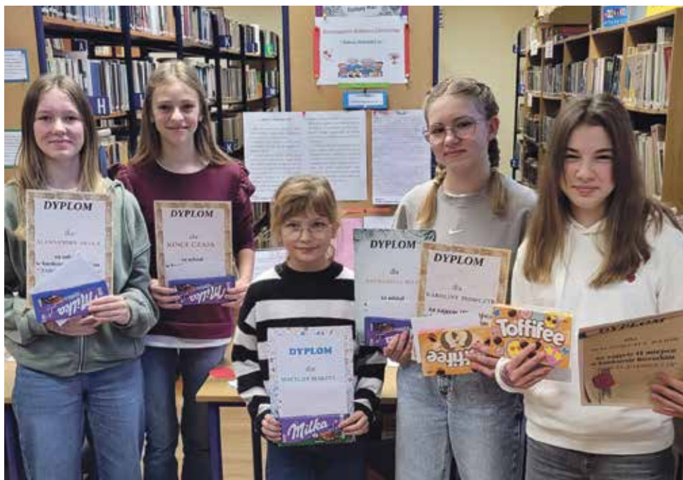
Uczestnicy konkursu otrzymali pamiątkowe dyplomy, bony подарunkowe oraz słodycze

Celem nadrzędnym konkursu było zainteresowanie się przeszłością własnej rodziny w oparciu o wspomnienia oraz rozwijanie umiejętności wyrażania myśli za pomocą tekstu pisanego. Ponadto celami konkursu były także kształtowanie oraz ukazanie wspólnej więzi dziadków z wnukami za pomocą opowieści i przybliżenie wychowawczej roli dziadków w kształtowaniu tożsamości młodego pokolenia.