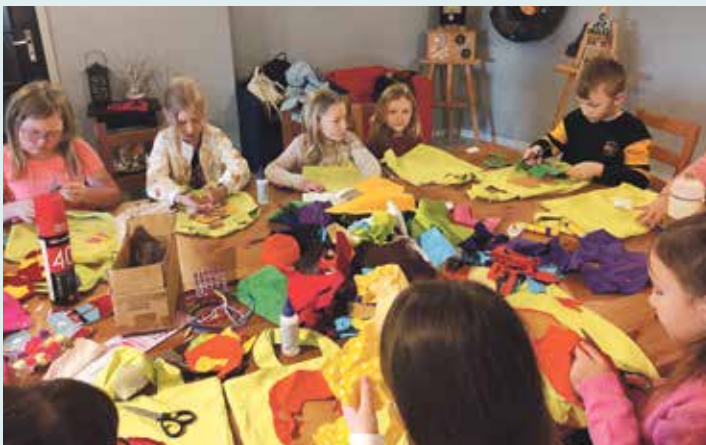
W woźnickim MGOK odbyły się warsztaty szycia, podczas których dzieci stworzyły wyjątkowe torby na różne okazje

Miłośnicy muzyki mieli okazję uczestniczyć w zajęciach ze-