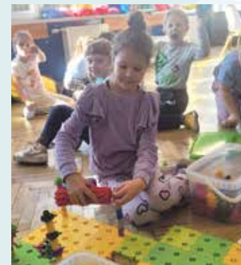
Kreatywna i świetna zabawa w szkole w Woźnikach

Równie interesujący program przygotowała Szkoła Podstawowa z Oddziałami Sportowymi im. Józefa Lompy w Woźnikach. Podczas półkolonii dzieci mogły uczestniczyć w warsztatach pla-