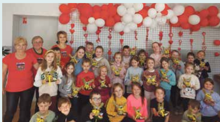
KGW „Przebojowe” z Psar przeprowadziły z dziećmi warsztaty robienia zajęczków z siana

Półkolonie dofinansowano w ramach zadań Gminnego Programu Profilaktyki i Rozwiązywania Problemów Alkoholowych oraz Przeciwdziałania Narkomanii na Terenie Gminy Woźnik