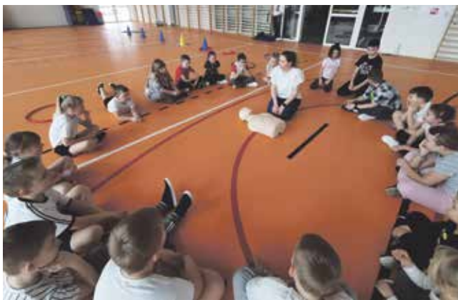
Zjęcia w Szkole Podstawowej w Lubszy

Zimowy wypoczynek obfitował w masę atrakcji i wartościowych zajęć.