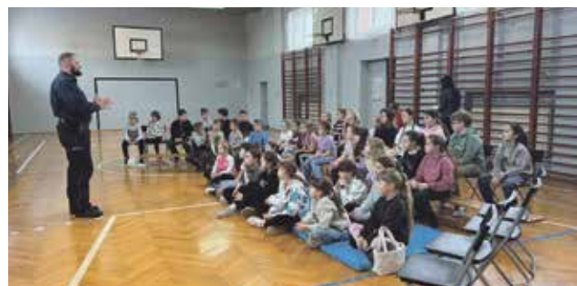
Spotkanie z policjantem w Szkole Podstawowej w Woźnikach

profilaktycznych oraz licznych warsztatach rozwijających zainteresowania. Było programowanie robotów, budowanie konstrukcji z klocków Lego, zajęcia językowe, plastyczne i sportowe. Dzieci chętnie spędzały czas także na świeżym powietrzu, korzystając z zimowej aury. Każdego dnia czekały na nie smaczne posiłki przygotowane przez szkolną kuchnię.