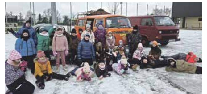
Zabytkowe samochody przy Szkole Podstawowej w Psarach

W Szkole Podstawowej w Psarach pierwszy dzień półkolonii upłynął pod znakiem integracji, zabaw ruchowych oraz zajęć plastycznych. W kolejnych dniach dzieci uczestniczyły w wyjątkowych spotkaniach z członkiniami Kół Gospodyń Wiejskich z Psar i Babienicy, które przybliżyły im lokalne tradycje i zwyczaje. Były tańce ostatkowe, prezentacja strojów ludowych oraz wizyta w szkolnej Izbie Regionalnej. Uczniowie korzystali z zimowej pogody, lepiли bałwana i jeździli na sankach. Ciekawą atrakcją była także możliwość obejrzenia zabytkowych samochodów. Dzieci przy-