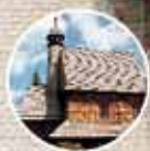
„Chrystus Zmartwychwstały” kościół św. Walentego w Woźnikach

Zdrowych i spokojnych Świąt Wielkanocnych w imieniu Rady Miejskiej i pracowników Urzędu Miejskiego w Woźnikach życzą