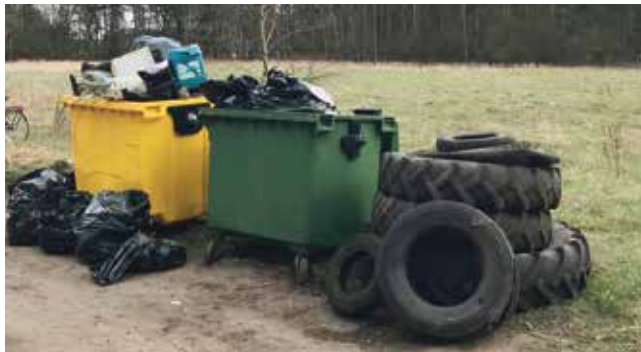
Gmina Woźniki udostępniła kontener i opłaciła odbiór zebranych śmieci