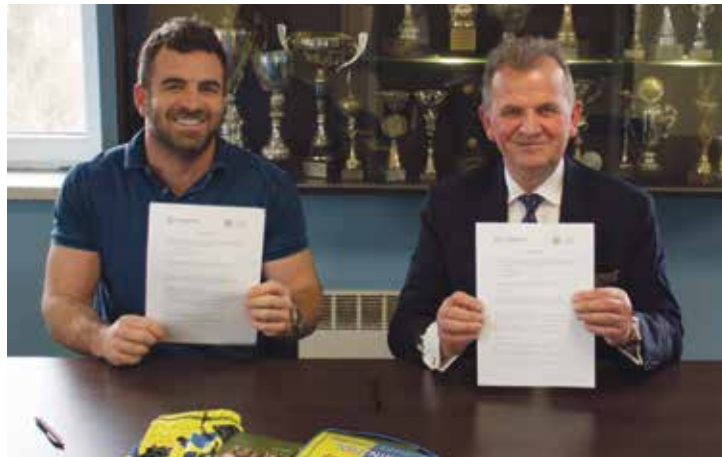
Umowę sponsorską podpisano w siedzibie klubu w Woźnikach

Seniorzy MLKS Woźniki grają w tej chwili w lidze okręgowej, a zarząd klubu, który od niemal roku działa w nowym składzie, stara się utrzymać wysoki poziom szkolenia oraz zachęcać do futbolu jak najwięcej młodych ludzi, zarówno chłopców, jak i dziewcząt. Działalność szkoleniowa klubu jest corocznie dofinansowywana z budżetu Gminy Woźniki w ramach realizacji zadań publicznych. Pozostałe środki klub pozyskuje z innych źródeł