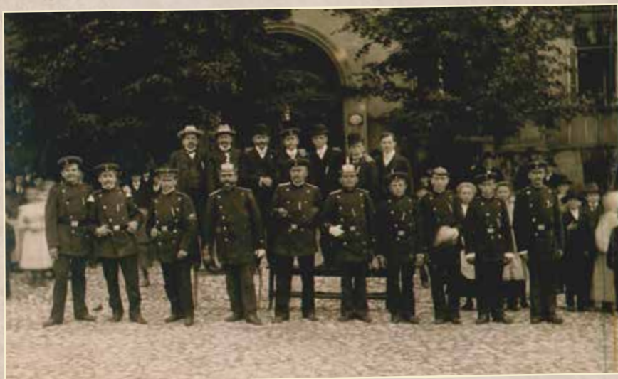
Członkowie Straży Ogniowej przed Ratuszem, rok 1908