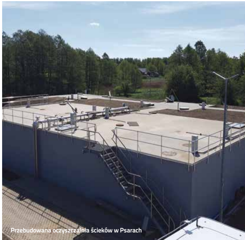
Przebudowana oczyszczalnia ścieków w Psarach

W naszej gminie działają dwie oczyszczalnie: w Woźnikach i Psarach. Pierwszą wybudowano w latach 90. minionego wieku. Obecnie jej technologia jest już przestarzała. Oczyszczalnia w Psarach jest bardziej zaawansowana technologicznie, a w październiku 2018 rozpoczęto prace związane z jej przebudową i rozbudową. Roboty zakończono w tym roku pod koniec lipca. Rozbudowa mechaniczno – biologicznej oczyszczalni w głównej mierze związana była z koniecznością zwiększenia jej przepustowości z obecnej średniodobowej: 200 m 3 /d do 400 m 3 /d. Co ma pozwolić na wybudowanie kanalizacji w kolejnych sołectwach gminy Woźniki. Obecnie przyjmuje ona ścieki z Psar, Babienicy i Piasku. W przyszłości wpływać mają tu nieczystości m.in. Kamienicy, Lubszy, Dyrda, Mżyków, Kamięskich Młynów, Drogobyczy. – Dopiero wtedy oczyszczalnia zacznie działać na pełnych obrotach. Przy dalszej rozbudowie kanalizacji sanitarnej jej moce przerobowe mogą okazać się jednak za małe. Dodam, że decyzja o przebudowie tego obiektu zapadła kilka lat temu. Według mnie lepszym rozwiązaniem, za porównywalne kwoty, byłoby wybudowanie w tym miejscu nowej oczyszczalni. Nowoczesnej, spełniającej