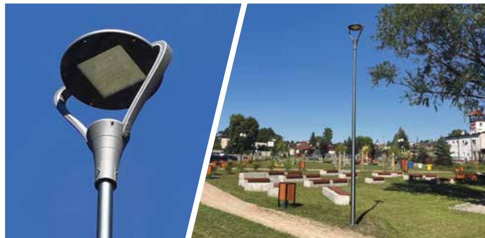
Nowoczesne i energooszczędne lampy zainstalowano także na terenie zrewitalizowanego PGR w Woźnikach

nych rozwiązań rachunek za prąd wyniesie około 150 tys. zł. Zaoszczędzone środki może- my przeznaczyć na inwestycje – mówi burmistrz Woźnik Mi- chał Aloszko. – Warto zazna- czyć, że nowe lampy poprawią widoczność i wpłyną na popra- wę bezpieczeństwa osób spacer- ujących po zmroku – dodaje. W ramach inwestycji wymie- nione będą lampy oświetlenia ulicznego oraz lampy wraz ze słupami oświetlenia parkowego na terenie całej gminy. Moder- nizacja obejmie przeszło 1000 opraw przy drogach wojewódz- kich i ponad 450 przy drogach