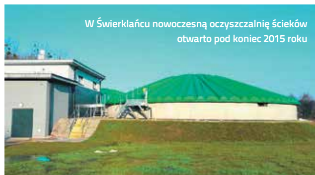
W Świerklańcu nowoczesną oczyszczalnię ścieków otwarto pod koniec 2015 roku

W ubiegłym roku, na zlecenie urzędu, powstała specjalna koncepcja. Projektanci po przeanalizowaniu potrzeb naszej gminy przedstawili roz-