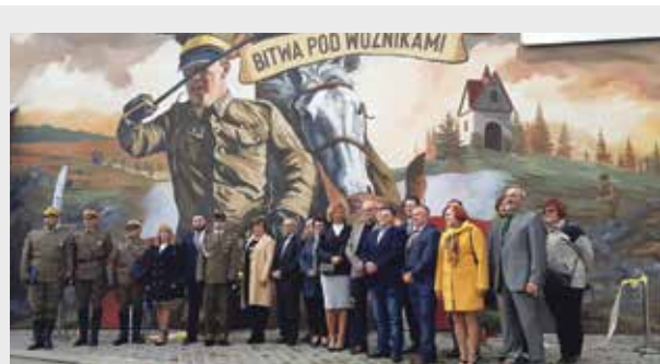
Zadanie „MUR, ALE historia Wojska Polskiego” zrealizowało Stowarzyszenie Ochotniczy Szwadron 3 Pułku Ułanów Śląskich, w ramach, niemal 30 tys. zł, dotacji otrzymanej z Ministerstwa Obrony Narodowej. Stowarzyszenie od wielu lat pielęgnuje pamięć o bitwie pod Woźnikami. Dzieje 3. Pułku Ułanów Śląskich stanowią bowiem ważną i barwną kartę w międzywojennej historii Górnego Śląska.

W obchodach 82. rocznicy wybuchu II wojny światowej uczestniczyły m.in. delegacje Urzędu Miejskiego, Rady Miejskiej, Ochotniczego Szwadronu 3 Pułku Ułanów Śląskich.