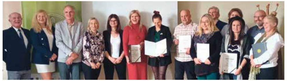
Wśród nagrodzonych tytułem „Marka Lokalna” ponownie znaleźli się mieszkańcy Gminy Woźniki. Na stronie www.lgd-brynica.pl dostępne są listy wszystkich laureatów z LGD „Brynica to nie granica”

W kategorii produkt spożywczy z terenu LGD „Brynica to nie granica” znalazły się aż cztery przysmaki z naszej gminy: miody z dodatkami, miody gąnkowe oraz syropy owocowe i kwiatowe wyprodukowa-