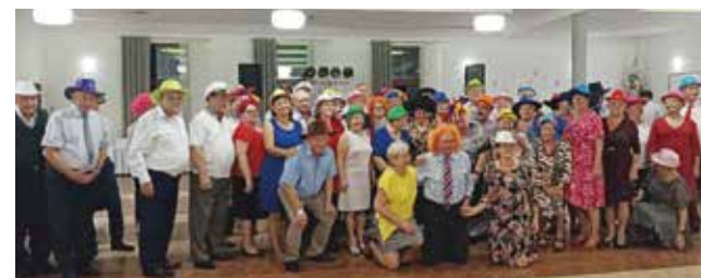
Działający w Woźnikach koło Związku Emerytów, Rencistów i Inwalidów znane jest z organizowania m.in. wycieczek i zabaw integracyjnych

gminy są pełni energii, otwarci na nowe doświadczenia i gotowi, aby czerpać radość z aktywnego życia. Dzięki zaangażowaniu lokalnych grup nasza gmina jest miejscem, gdzie starsze pokolenia mogą rozwijać swoje pasje i wspierać życie lokalnej społeczności.