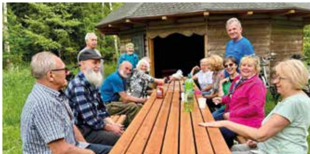
Woźnicki Uniwersytet Trzeciego Wieku podczas spotkania w plenerze

cja była świetną okazją dla słuchaczy Uniwersytetu do poszerzenia wiedzy na temat nowoczesnych technologii.