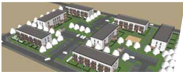
Tak może wyglądać osiedle wybudowane w Woźnikach przez Społeczną Inicjatywę Mieszkaniową (wizualizacja SIM Śląsk Północ)

na zaciągnięcie kredytu, ale są rozwojowi, mają potencjał i chcą pójść na przysłowiowe swoje cztery kąty. To bowiem głównie tej grupie dedykowany jest ten program – podkreśla Michał Aloszko, burmistrz Woźnik.