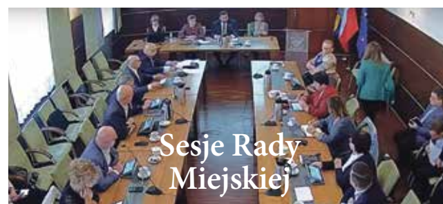
Sesje Rady Miejskiej

ści Budynków stosowną deklarację). Wedle założeń, w tym i następnym roku mieszkańcy mogą w ten sposób zakupić po 1,5 tony węgla. – Samorządy po raz kolejny stanęły przed wyzwaniem. Ustawa jest w trakcie procedowania, czekamy na jej ostateczny kształt i wówczas o szczegółach poinformujemy mieszkańców – podkreśla burmistrz. Podkreślił, że samorządy nie będą mieć żadnego wpływu na jakość dystrybuowanego węgla oraz asortyment, jaki będzie ostatecznie dostępny.