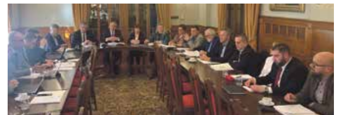
Zgromadzenie wspólników SIM Śląsk Północ odbyło się w Czarnym Lesie

Przypomnijmy, że spółkę SIM Śląsk Północ powołano 28 lutego 2022 r., a przystąpiły do niej gminy z powiatów lublinieckiego, kłobuckiego, częstochowskiego, tarnogórskiego i gliwickiego: Kocha-