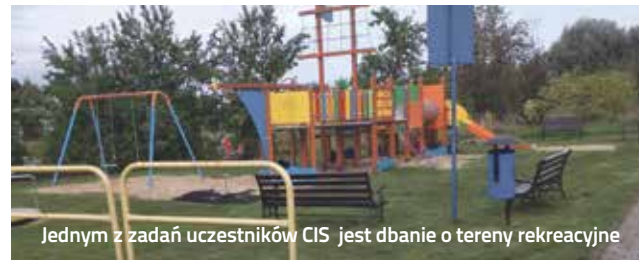
Jednym z zadań uczestników CIS jest dbanie o tereny rekreacyjne

musi wziąć życie w swoje ręce. Trzon CISu stanowi grupa gospodarczo-porządkowa, której uczestnicy pod okiem instruktora zawodu przyuczają się do funkcji pracownika gospodarczego. Można ich spotkać na placach zabaw, ciągach pieszych, skwerach, gdzie dbają o naszą gminną zieleni i porządek w miejscach publicznych. Duża grupa uczestników to osoby rozlokowane w tzw. pracowniach zewnętrznych, czyli instytucjach i firmach współpracujących z CIS, które zorganizowały w swoich siedzibach odpowiednie stanowisko z instruktorem. Uczestnicy nie tylko przyuczają się dzięki temu do zadań