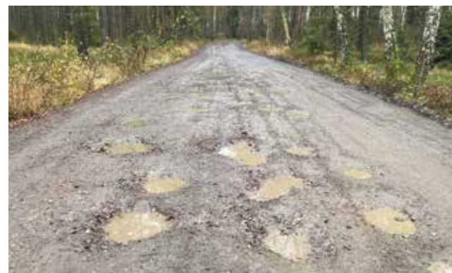
Droga na Dąbrowę