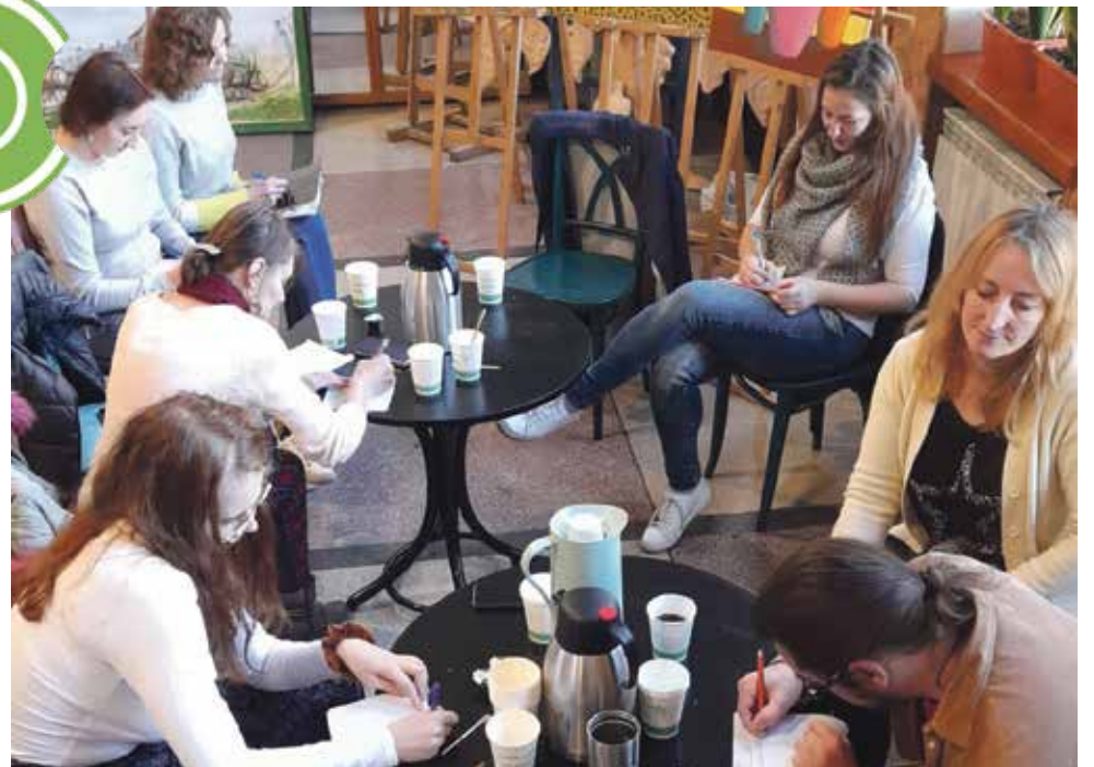
Reintegracja społeczna to m.in. wsparcie grupowe, konsultacje indywidualne z psychologiem, doradcą zawodowym i innymi specjalistami

CIS ruszył pod koniec kwietnia. Niektórzy wpadli na chwilę, nie dali rady. Większość jest do dziś... i nie żałują. Centrum Integracji Społecznej w Woźnikach pozwoliło im przecież stanąć na nogi, uwierzyć w siebie.