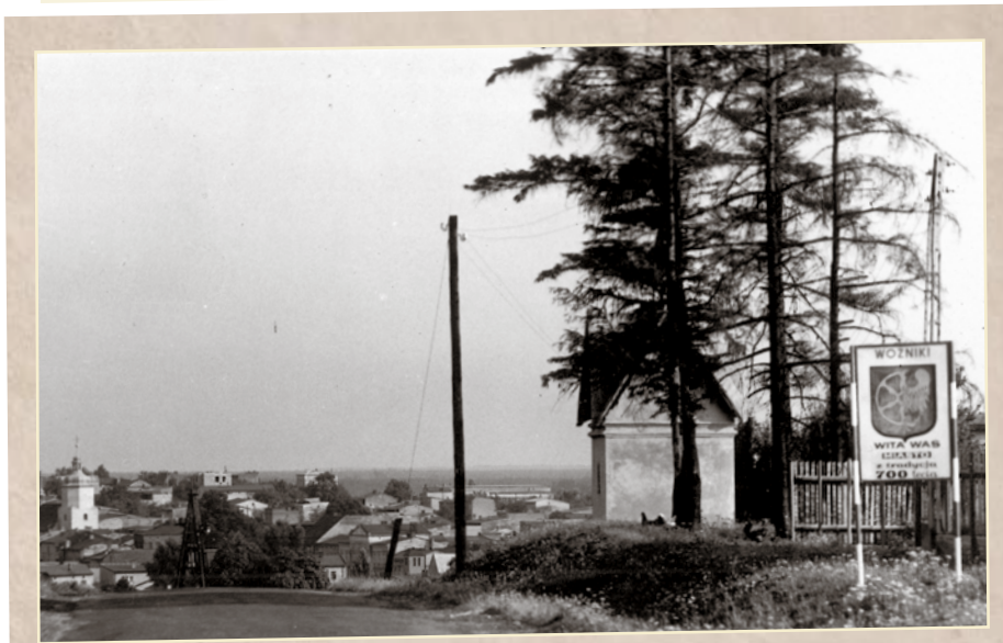
Woźniki, rok 1970